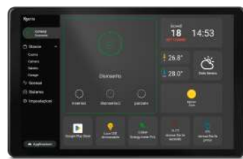
KSI2100045.302 - nera

La tastiera può essere alimentata PoE (48V) oppure mediante alimentatore (12-16V) o cavo USB Type-C.