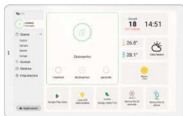
KSI2100045.301 - bianca

Con uno spessore contenuto e uno schermo HD da 10,1", si integra perfettamente in qualsiasi ambiente grazie al montaggio a parete (scatola DIN 503 o scatola tonda 60 mm), sia in orientamento verticale sia orizzontale. Il retro magnetico della tastiera consente un'installazione rapida su scatole da incasso europee standard.