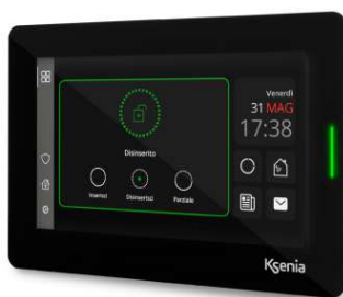
KS12100050.302 - nero

La tastiera creo-S offre una protezione avanzata contro tentativi di manomissione grazie alla protezione antistrappo per rilevare la rimozione non autorizzata del dispositivo, blocco temporaneo dell'accesso in caso di inserimento errato del PIN (max 3 tentativi).