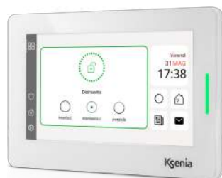
KS12100050.301 - bianco

Il touchscreen capacitivo offre una risposta al tocco precisa e immediata ed integra un'area RFID per la lettura delle chiavi di sicurezza RFID Ksenia. Un LED RGB per la segnalazione di stato, un buzzer e due morsetti configurabili come Ingresso (NC, NA o bilanciati) oppure come Uscita (OC 500 mA max) completano le funzionalità del dispositivo.