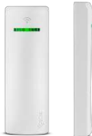
KSI2200000.310 - volo bianco KSI2200000.300 - volo nero

volo è il lettore di prossimità da esterno che permette di eseguire in modo semplice l'attivazione e la disattivazione di 5 scenari programmati, tra cui l'inserimento e il disinserimento del sistema di allarme. Il lettore volo presenta un LED RGB che dispone di 5 colori diversi – rosso, verde, blu, giallo e bianco – ognuno dei quali può essere associato a uno scenario: basta avvicinare la Mini Tag al lettore, attendere che il LED si accenda del colore associato allo scenario e allontanare la chiave. Il lettore volo ha anche la funzione di visualizzatore dello stato impianto: si accenderà il colore verde per segnalare che l'impianto è disinserito e pronto all'inserimento, il rosso quando è totalmente inserito e il blu quando è parzialmente inserito.