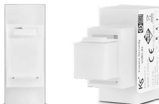
KSI2200002.300 - volo-in

volo-in è il lettore di prossimità da interno, in tecnologia RFID, con segnalazione acustica e luminosa, che permette di eseguire in modo semplice l'attivazione e la disattivazione di 5 scenari programmati, tra cui anche l'inserimento e il disinserimento del sistema di allarme.