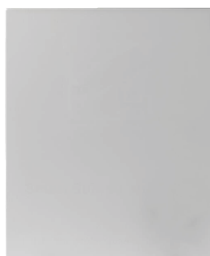
BS-SBA002GB Base da pavimento 400mm (A) x 380mm (L) x 270mm (P)