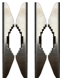
BS-SBA001PMA Kit fissaggio a palo