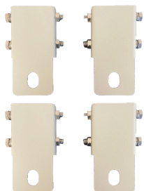
BS-SBA001WMA Kit fissaggio a muro